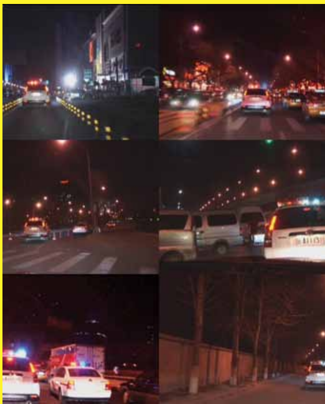
I DON'T SLEEP TONIGHT, 2010