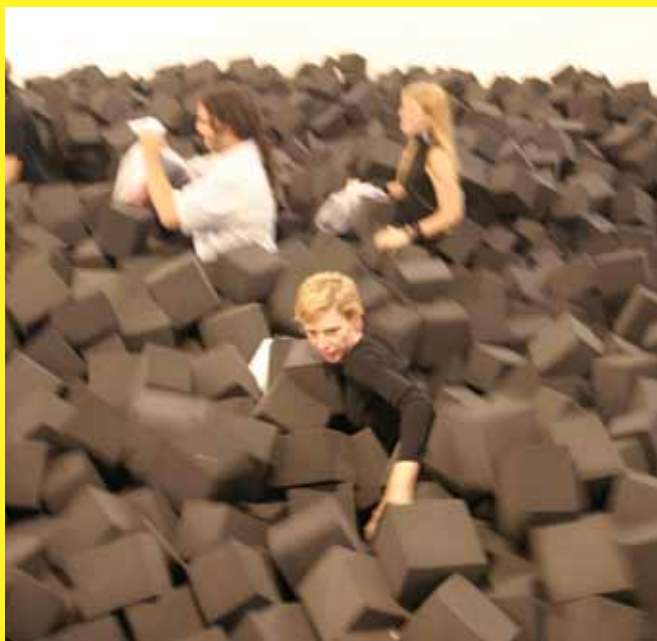
THE STRONGEST DRAGON GETS ACROSS THE RIVER, 2005