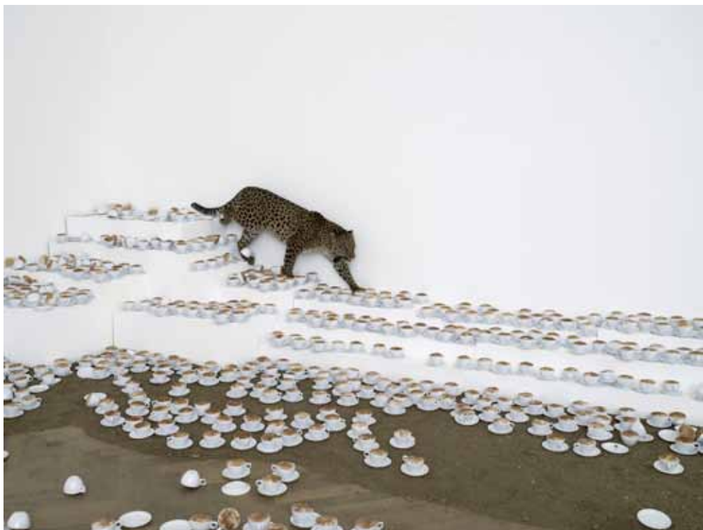
© PAOLA PIVI, ONE CUP OF CAPPUCCINO THEN I GO, 2007. PHOTO HUGO GLENDINNING