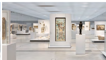
LE LOUVRE-LENS UN GRAND MUSÉE À PROXIMITÉ