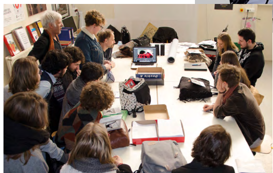
▲ Rencontres avec des artistes ▶