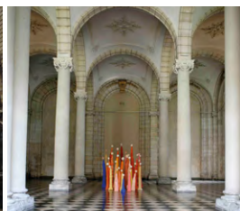
MUSEE DES BEAUX-ARTS D'ARRAS UN PARTENAIRE CULTUREL