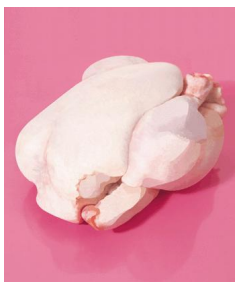
Image calme, nette, précise, qui évoque franchement l'univers de la publicité. L'artiste n'a pas voulu nous réjouir l'œil mais plutôt nous livrer une réflexion sur l'alimentation moderne. Son rôti, quasiment désincarné, symbolise un rapport hygiéniste à la nourriture qui privilégie des produits aux apparences lisses et parfaites mais dont la saveur est secondaire.

photographie couleur 100x120 chacune Un simple rôti lisse et luisant se reflète légèrement sur son support tout aussi lisse et luisant Aucun autre élément sur cette nature morte photographique