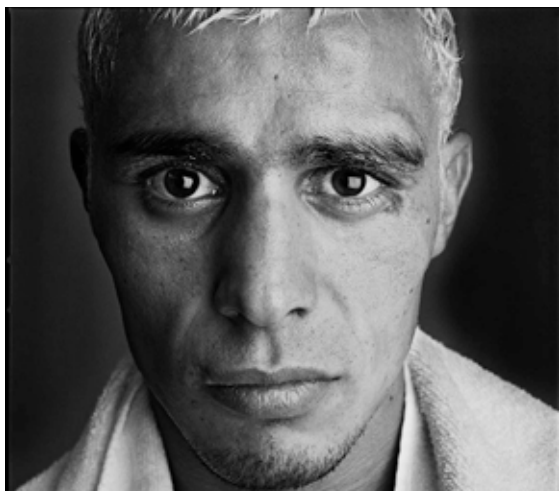
Laurent Gudin, Paris, Palais Omnisport de Bercy, Brahim Asloum, Novembre 2004 © Laurent Gudin