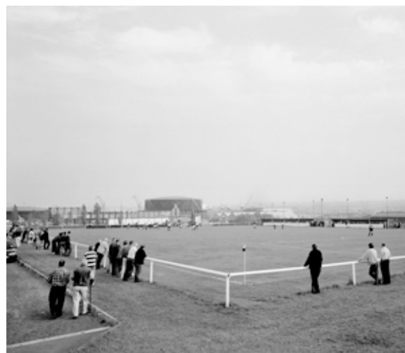
Ken Grant, Terrains de foot de Poulton, quartier de Liverpool, années 80, série Scousers