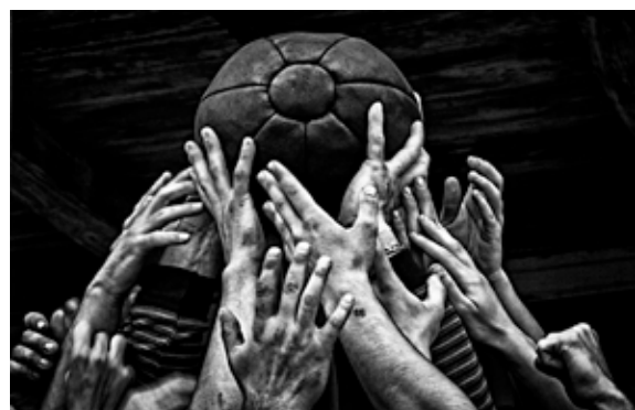
Cristina Aldehuela & Jordi Perdigó, série Lelo , 2015