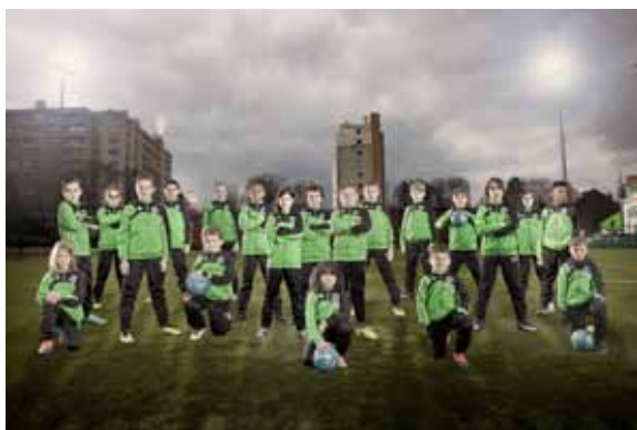
Pauce, ES Lille Louvière Pellevoisin Saint Maurice, série Champions en devenir , 2018

Et aussi dans la ville : Pano City, installations à la Vieille Bourse, au Palais des Beaux-Arts, au Centre Commercial Euralille et dans les Galeries marchandes Auchan.