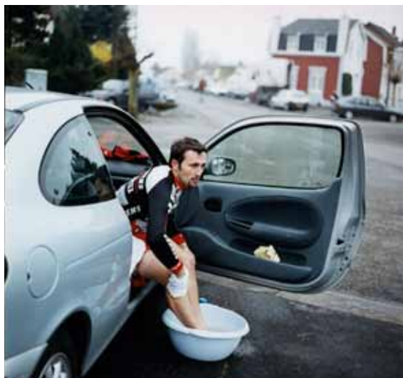
Xavier Lambours, série Vélolavie , 2004