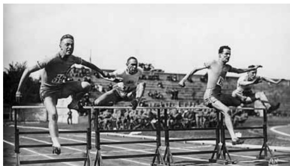
Paris 1924 Paris 1924 OG, Athletics, 110m hurdles Men

En partenariat avec le journal La Voix du Nord , des clichés de presse de la mythique course cycliste du Paris-Roubaix témoigneront de son histoire singulière dans le paysage sportif de la région mais aussi celui du pays. À travers cette exposition, c'est toute la difficulté et le dépassement de ses limites physiques qu'exploreront les témoignages photographiques de cette course que l'on appelle l'Enfer du Nord .