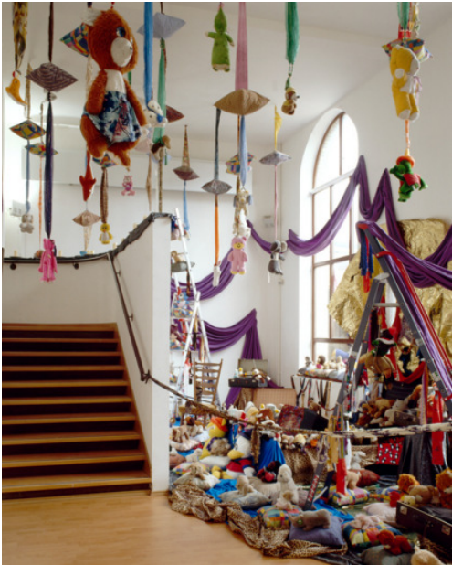
Charlemagne PALESTINE (1945-), Bordel sacré , 1997, installation d'objets et documents trouvés, tissu de culte et de camelote, d'ethnies différentes ; deux valises, deux lecteurs et moniteurs vidéo et CD enregistrés spécifiquement pour l'installation, enregistrements uniques, objets trouvés, tissus, cire, métal, papier aluminium, dimensions variables pour un espace de 40m 2 à 80m 2 , collection Frac Nord - Pas de Calais, Dunkerque, France.

L'objet du quotidien fait ici partie intégrante de l'œuvre, il est utilisé et manipulé par l'artiste pour donner sa propre vision sur le monde de l'enfance et ses croyances.