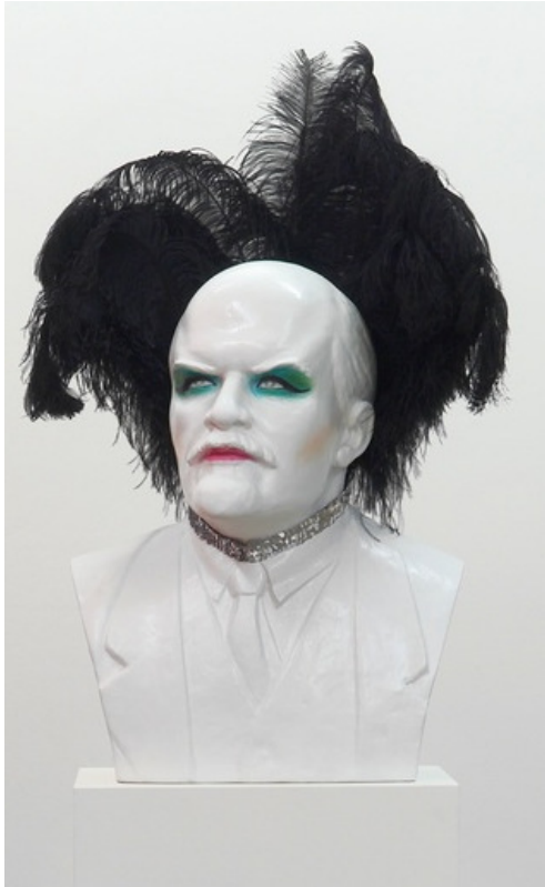
Scott KING (1969-), Diana , 2008, buste de Lénine maquillé avec plumes, plâtre, plume d'autruche, socle 100 x 64 x 48 cm, socle : 110 x 50 x 40 cm, collection Frac Nord - Pas de Calais, Dunkerque, France.

Comme dans la tradition du carnaval, où chacun se grime de manière fantasque pour faire d'un temps festif un exutoire, dans l'œuvre de Scott King, le travestissement du buste du dictateur communiste permet de tourner en dérision son image. Comme le démontre Diana , des opposés peuvent s'associer, se confronter pour faire sens au sein d'une même œuvre.