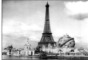
1887 -1889 : Eiffel construit sa tour.

1900 : Les artistes veulent créer un ART NOUVEAU qui s'inspire de la ..... Ils veulent que leur art puisse être accessible à tous le monde et réinventent les ..... du quotidien.