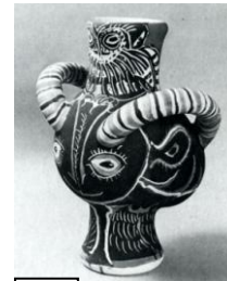
1 PICASSO 1961 Faune et chouette

Au 20 ème siècle, la nature reste une source d'inspiration et de réflexion pour les artistes :