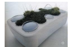
CGD WHIRLPOOL Europe Biologic 2003 (Prototype de machine à laver)