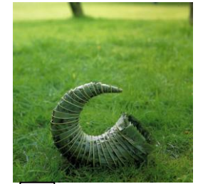
3 GOLDWORTHY 1987 Come verte en châtaignier