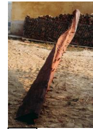
2 PENONE 1988 Hélicoïdal