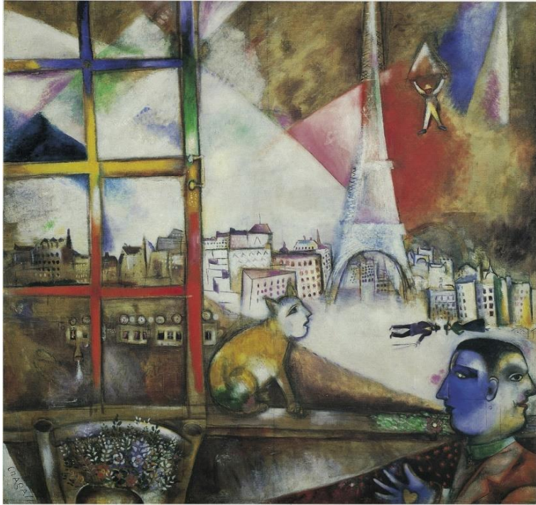
Marc CHAGALL (1887-1985) Paris par la fenêtre , 1913 Huile sur toile 136 x 141,9 cm