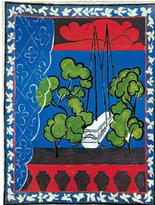
Henri MATISSE (1869-1954) Tahiti II ou Fenêtre à Tahiti , 1936 Gouache sur toile. 240 x 195 cm