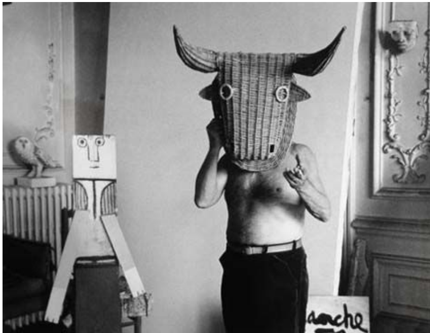
IMAGE 6 autoportrait de Pablo Picasso inspiré d'un masque originaire d'Afrique.

IMAGE 5 l'artiste Pablo Picasso dans son atelier se cachant derrière un masque.