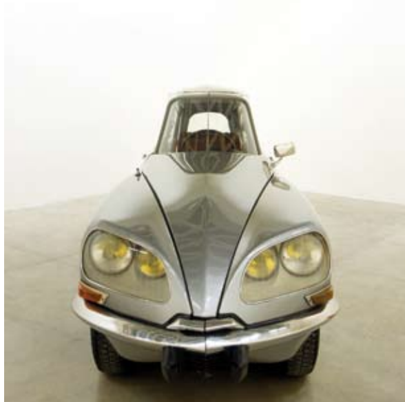
← GABRIEL OROZCO La D.S.

Les œuvres du second plateau analyseront les échanges, articulations et interactions qui peuvent exister entre l'artiste et la société, dans son rapport au monde marchand, à l'environnement, au politique, aux conflits... Un grand nombre de ces œuvres pointeront les failles d'une société basée sur l'image et la consommation.