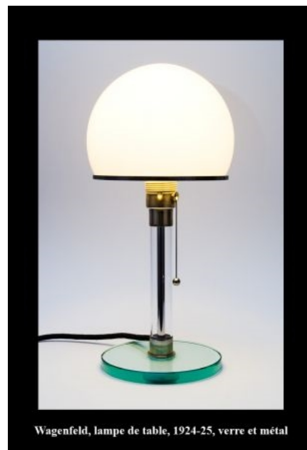
Wagenfeld, lampe de table, 1924-25, verre et métal